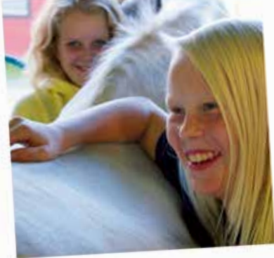
Alla ska trivas

Det viktigaste med en "Vi i Stallet – utbildning" är inte den avslutande tävlingen, utan att många barn och ungdomar i klubben lär sig mer och har roligt tillsammans.