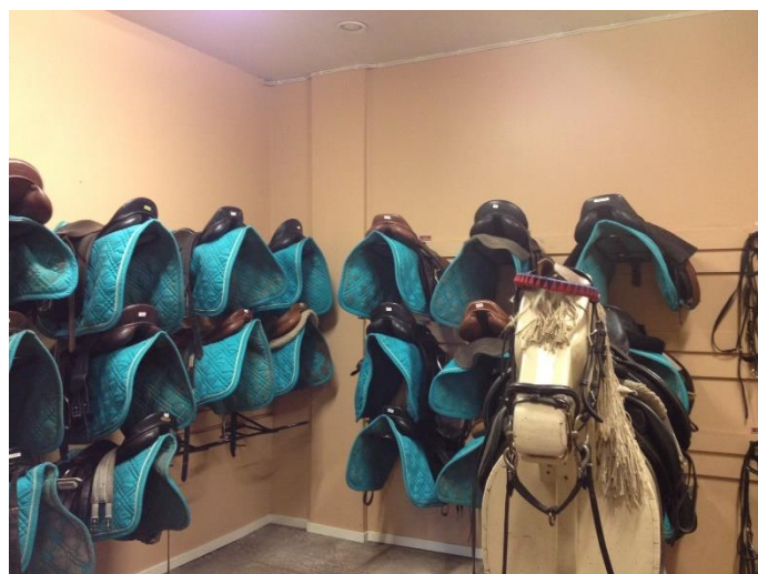
I sadelkammaren på Christinehams RK råder god ordning.

Besöksgruppen har gjort 5 besök på ridskolor under året för framtida kvalitetsmärkning. Vi ser att ridskolorna i Värmland håller bra kvalitet och att hjälp från kommunerna behövs för att rusta och modernisera anläggningarna som börjar bli slitna.