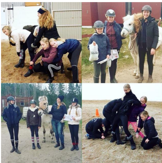
Deltagare på Ryktmästerskapen som DUS arrangerar

Vår ungdomssektion skall ha en särskild eloge för sitt aktiva arbete. Dels för att de medverkar i distriktets övriga verksamhet samt speciellt för att de driver egna aktiviteter såsom bussresor och anordnar galor. Vi kan jämföra med andra distrikt där det ofta är svårt att överhuvudtaget få ungdomarna med i distriktsverksamheten. Vi hoppas att denna aktiva ungdomsverksamhet skall fortsätta i Värmland