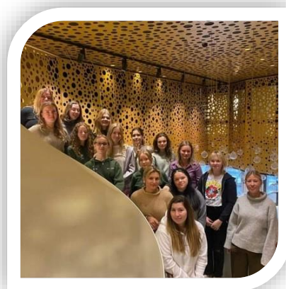
Bild från träffen i Stockholm

Vi tackar för i år och ser fram emot det nya året, som DUS Södermanland hoppas kunna fylla med intressanta och inspirerande aktiviteter.