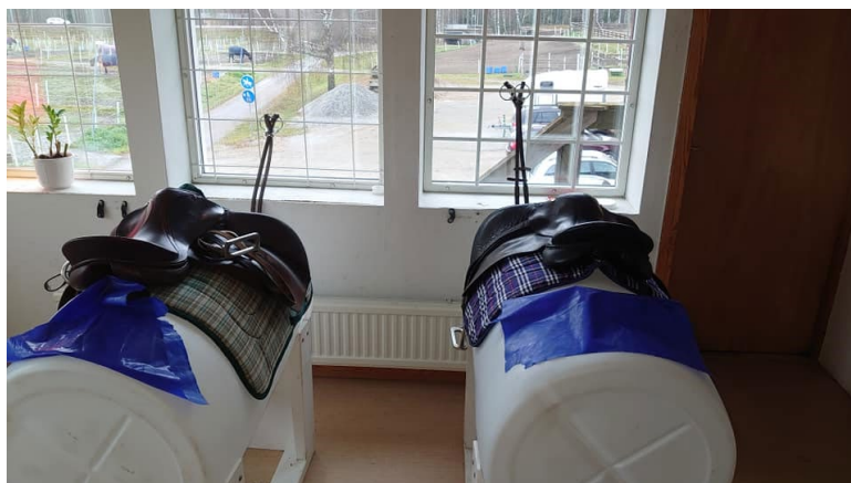
Träningshästar på Arvika Ridklubb

Besöksgruppen har gjort 6 besök på ridskolor under året för framtida kvalitetsmärkning. Kvalitetsmärkningen ligger nära på några av föreningarna och vi ser fram emot att kunna dela ut skylten till en eller två föreningar under 2021.