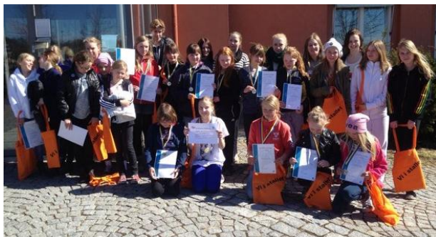
Bild på alla deltagare i Vi i Stallet 2013.