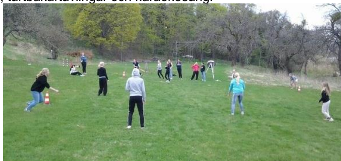
Bild från femkamp under ULK på Kungsörstorp.

DUS har under året varit kvällsaktivitetsledare på alla ULKar som varit. Kvällarna har bl.a. bjudit på femkamper, tårtbakartävlingar och karaokesång.