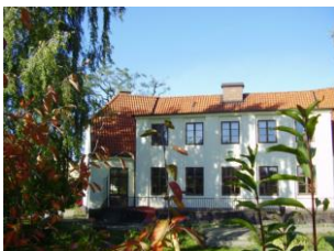
STF Landskrona Vandrarhem

Väljer ni att bo på något av hotellen bor ni central och det tar ca 7 minuter med bil till tävlingshallen.